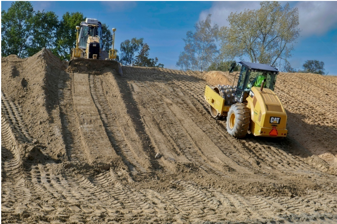
Mise en œuvre et compactage d'un sol argileux traité à la chaux lors de la construction d'une carapace sur un ouvrage existant par recouvrement de talus (pente H = 3 ; V = 1 )- Chantier expérimental de Vlassenbroek (B) - Photo Michel Froumentin 2019