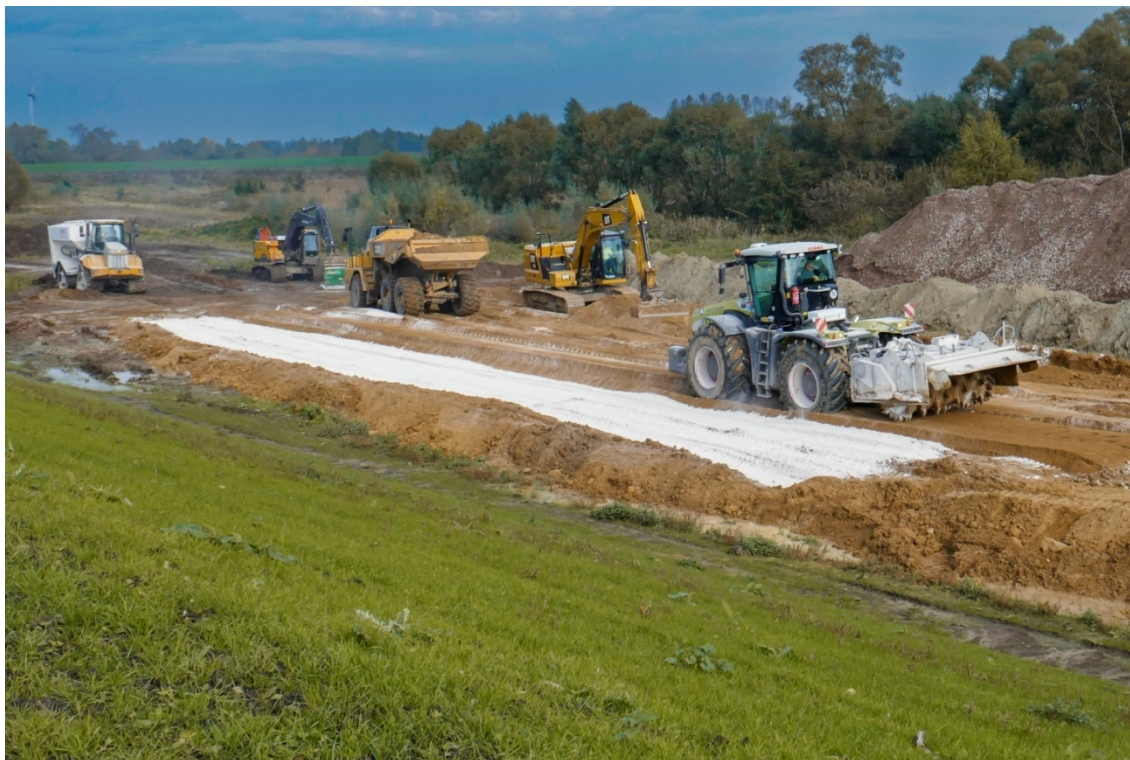
Traitement à la chaux d'un sol argileux sur plate-forme dédiée - Chantier expérimental de Vlassenbroek (B) - Photo Michel Froumentin 2019

Les fonctions d'un ouvrage hydraulique, ou d'un composant de l'ouvrage, ont été développées dans le Bulletin 195 de la CIGB. Elles sont synthétisées dans le Tableau 1. Le document fait référence à ces fonctions lorsque nécessaire.