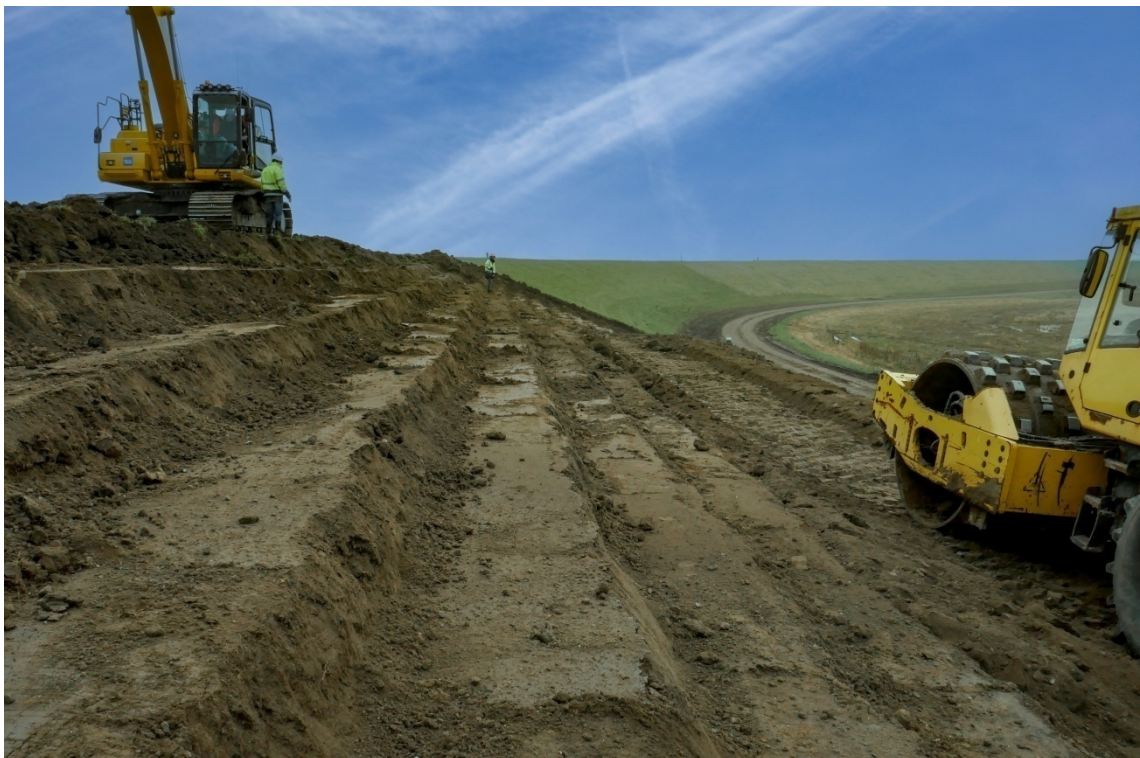
Compactage d'une couche de sol argileux traité à la chaux lors de la construction d'une carapace d'un ouvrage existant par la technique de redans Chantier expérimental d'Hedwigepolder (NL)