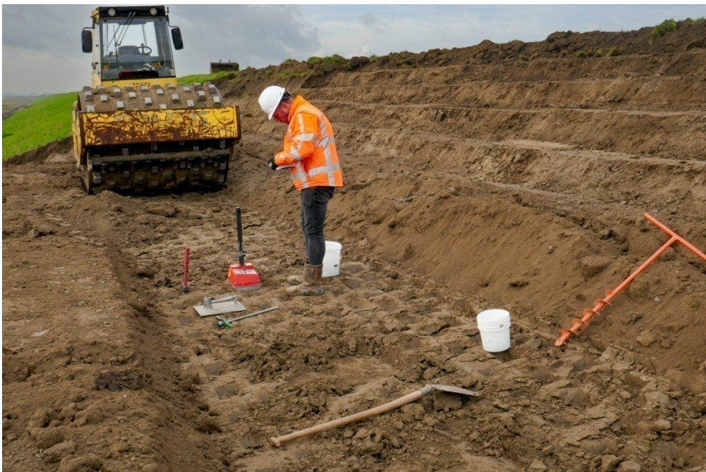
Contrôle du compactage au nucléodensimètre d'une couche de sol argileux traité à la chaux - Chantier expérimental d'Hedwigepolder (NL) - Photo Michel Froumentin 2021