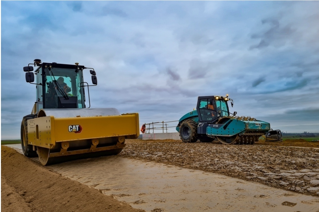
Compaction d'une couche de sol argileux traité à la chaux au compacteur vibrant à pieds dameurs et au compacteur vibrant à cylindre lisse - Construction du démonstrateur d'écluse du CSNE à Marquion (F - 62)