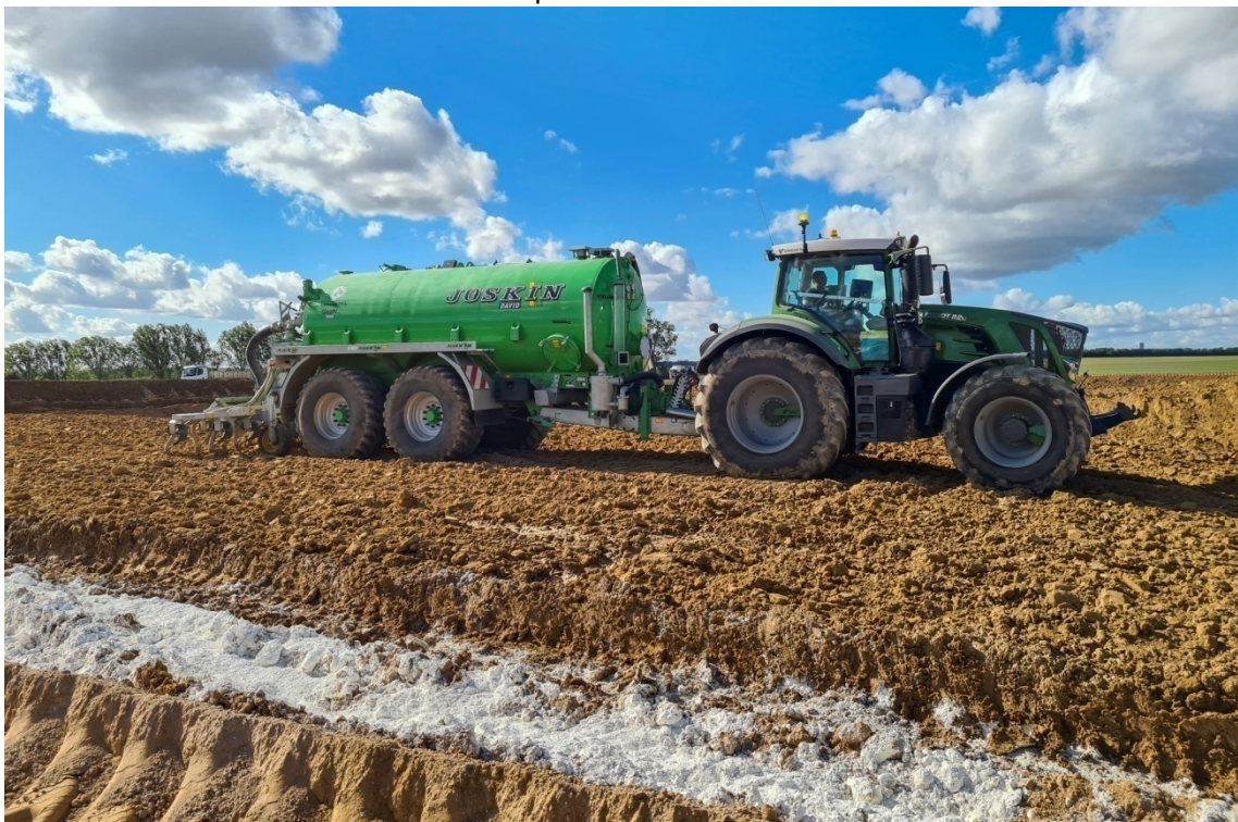
Ajustement hydrique à l'arroseuse enfouisseuse d'un sol argileux traité à la chaux