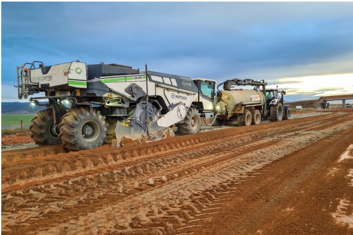
Ajustement hydrique et malaxage d'un sol argileux traité au liant hydraulique - Chantier de la déviation de Brioude (F - 43)