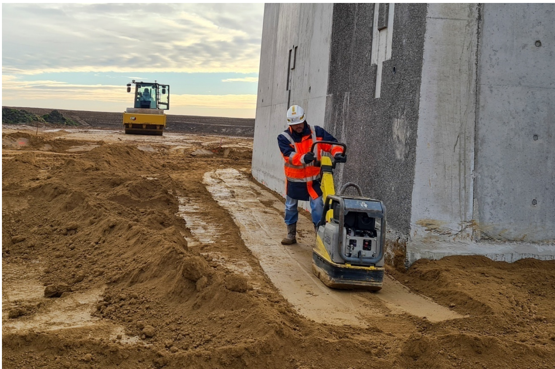
Compactage à la plaque vibrante lourde d'une couche de sol argileux traité à la chaux autour d'un ouvrage - Construction du démonstrateur d'écluse du CSNE à Marquion (F - 62)