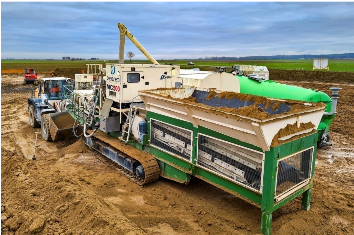
Centrale de traitement de capacité 270 t/h – Construction du démonstrateur d'écluse du CSNE à Marquion (F - 62)