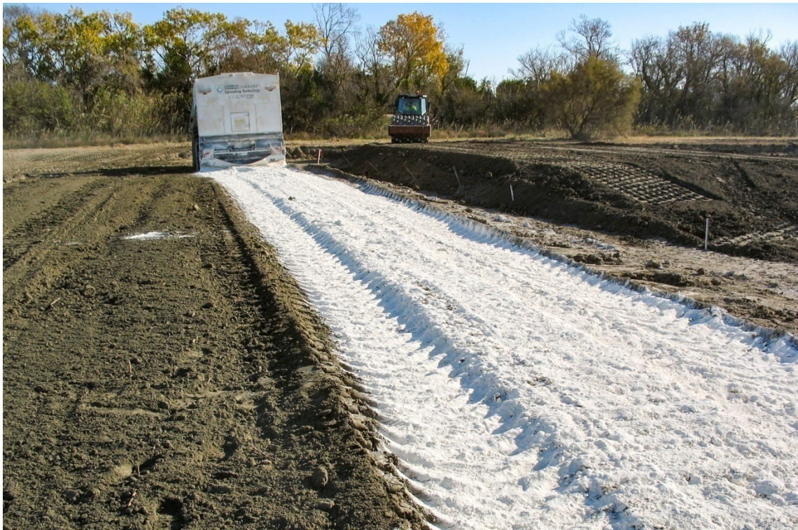
Epandage de la chaux pour traitement sur plate-forme dédiée d'un sol argileux - Construction des plots expérimentaux du SYMADREM à Salin-de-Giraud (F - 13)