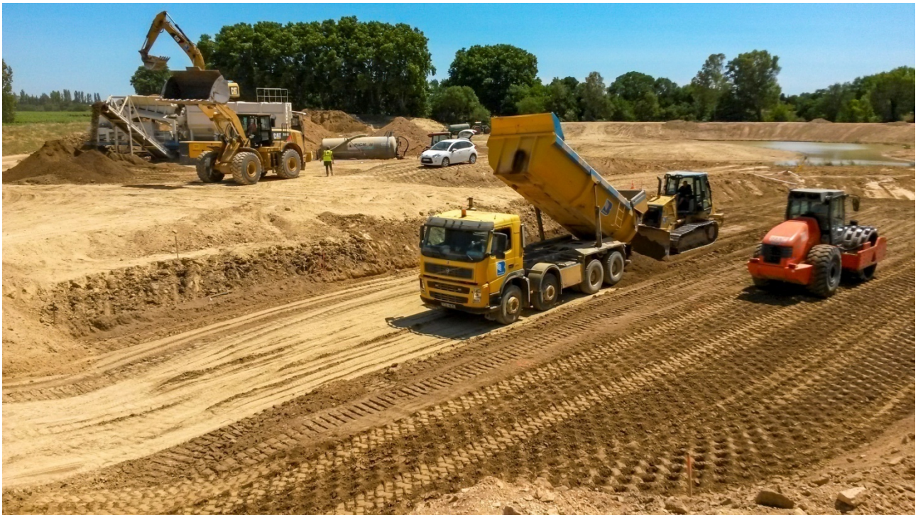
Centrale de traitement, mise en œuvre et compactage d'un sol argileux traité à la chaux pour la construction du démonstrateur DigueELITE - Chantier expérimental du Vidourle (F – 30)