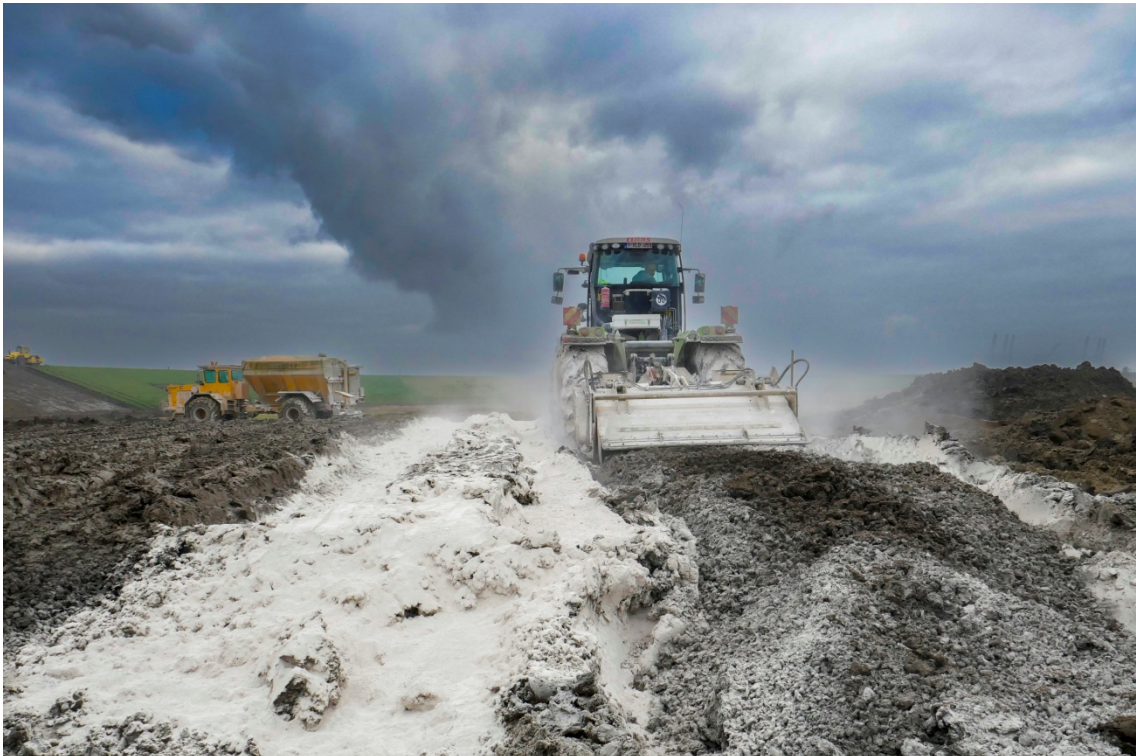
Malaxage d'un sol très argileux humide traité à la chaux – Chantier expérimental d'Hedwigepolder (NL)