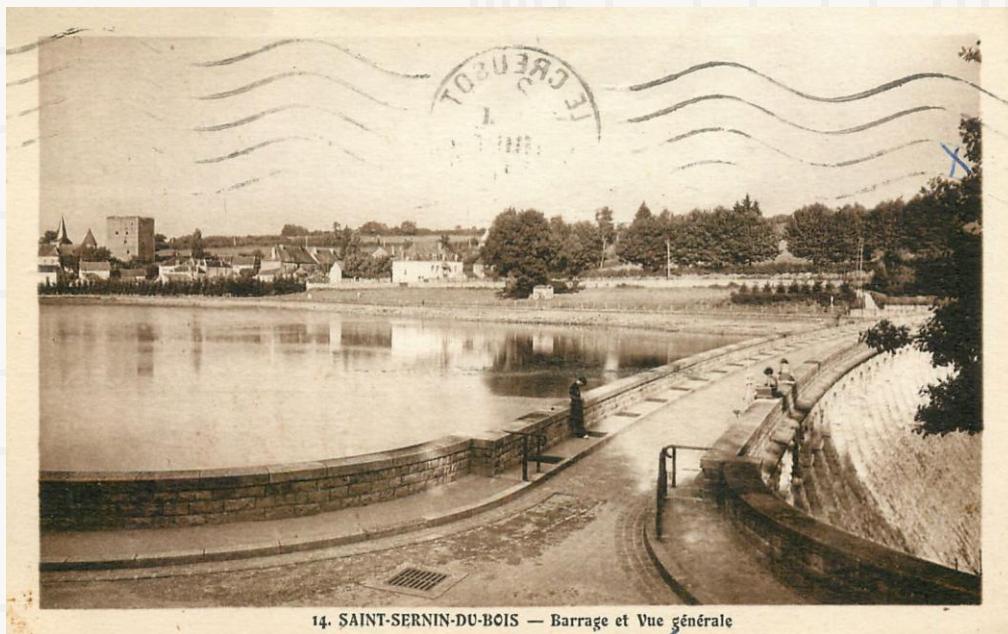
14. SAINT-SERNIN-DU-BOIS — Barrage et Vue générale