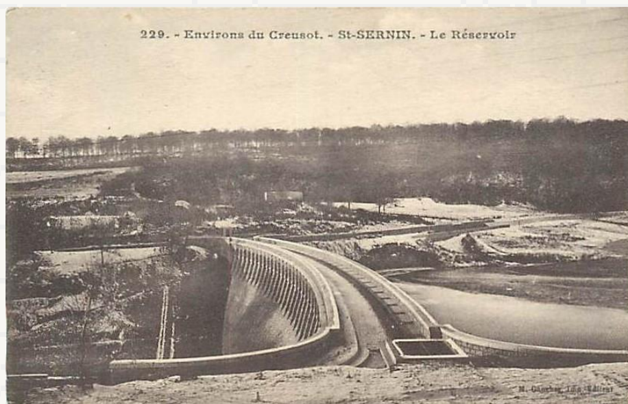
229. - Environs du Creusot. - St-SERNIN. - Le Réservoir