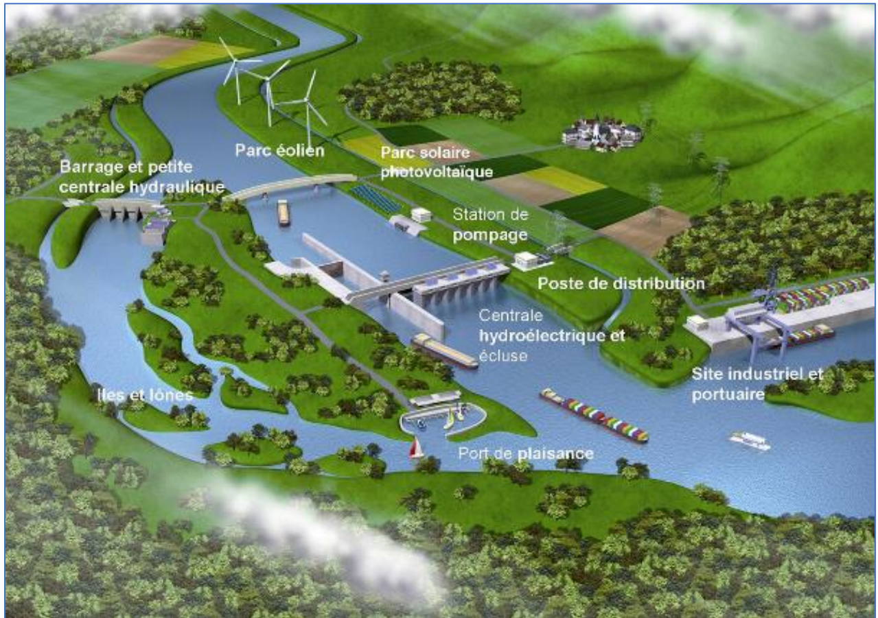
Figure 4 Schéma d'un aménagement hydroélectrique au fil de l'eau

Les équipements constitutifs de ces ouvrages au fil de l'eau concernés par l'anticorrosion sont : Vannes évacuateur de crue (au barrage) ; Vannes aval (usine) ; Turbines ; Alternateur ; Portiques de manutention ; Portes d'écluses