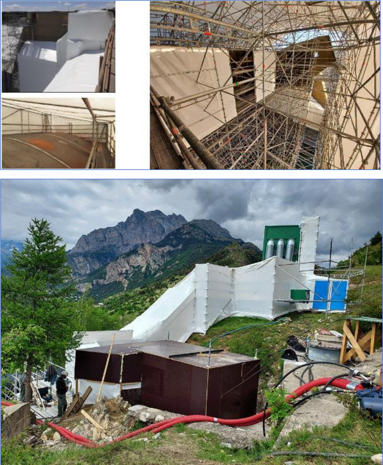
Figure 6 Exemples de chantiers anticorrosion

A ce jour les chantiers en France et en Suisse sont réalisés par une demi-douzaine de sociétés applicatrices. Le rythme et le volume de travaux évalués pour les prochaines années nous laissent penser que cette capacité à faire ne sera pas suffisante pour répondre au besoin s'il n'y a pas d'évolution de la filière industrielle, qu'elle soit humaine comme technologique.