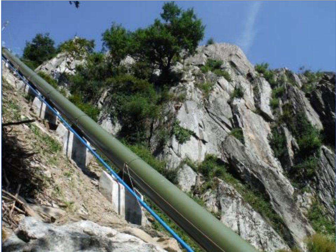
Figure 2 Photo d'une conduite forcée