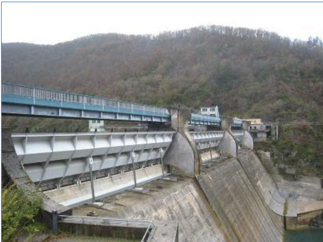
Figure 3 Photo d'une évacuateur de crue avec ses 3 vannes