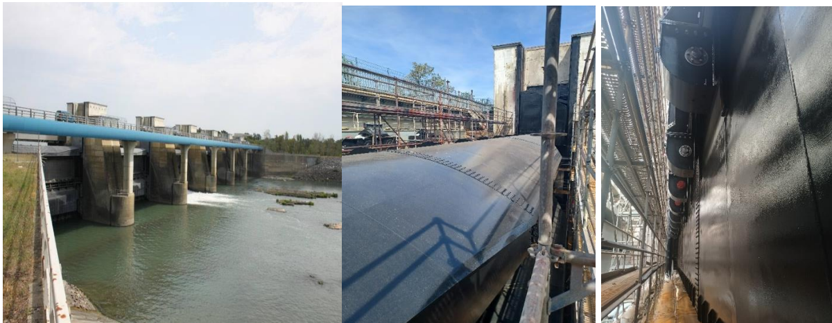
Vanne V6 barrage Beauchastel : les 6 vannes, le déversoir vue côté aval et rails et contre-galets côté amont.

Le développement de l'analyse multicritère nécessite en premier lieu une définition aussi précise que possible de l'objet de l'évaluation et de ses limites de sorte que les procédés ou scénarios soient évalués sur la base d'une référence commune.