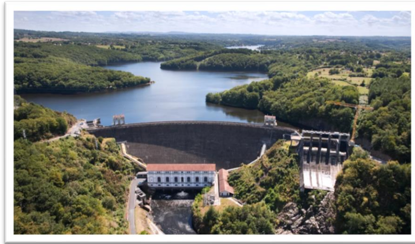
Barrage d'Eguzon, 100 ans en 2026